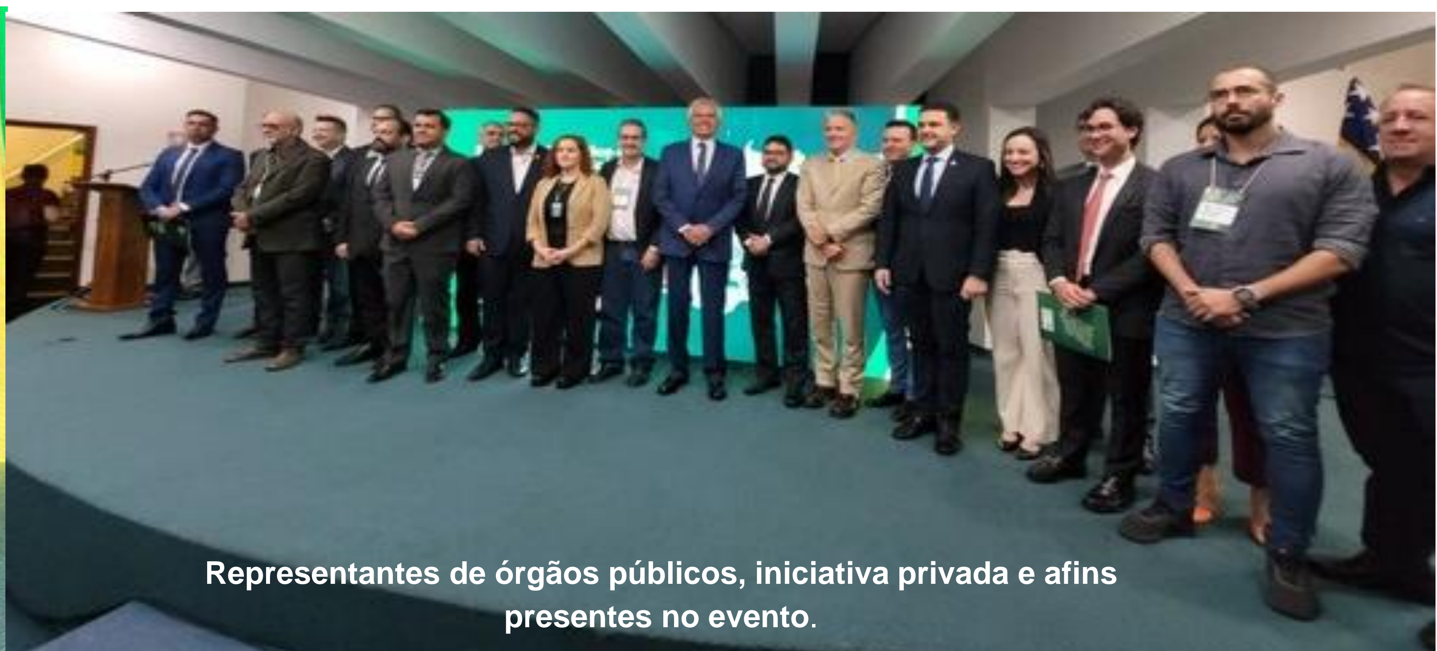
Representantes de órgãos públicos, iniciativa privada e afins presentes no evento.