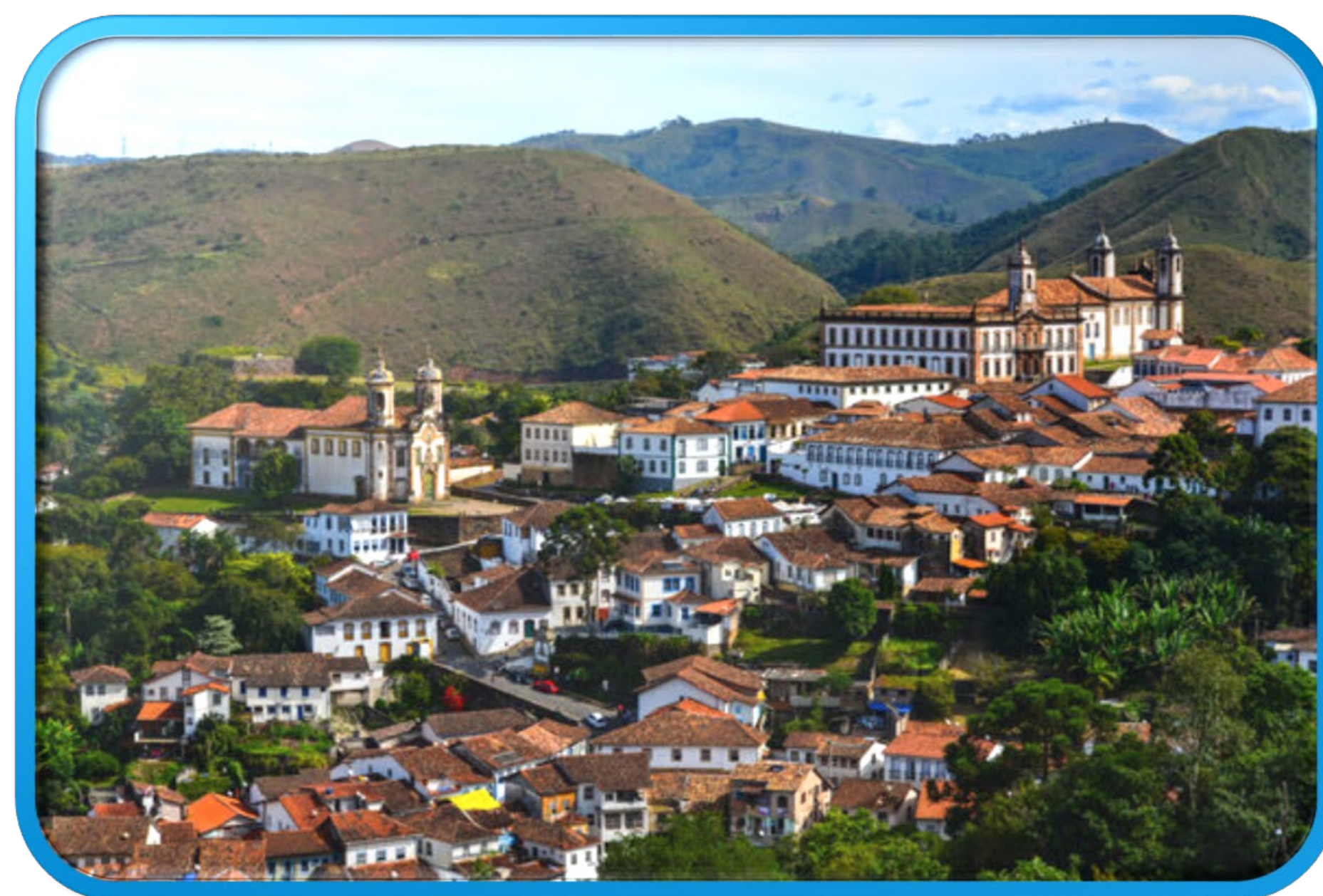
Cidade de Ouro Preto, MG.

O produto elaborado pelo Serviço Geológico do Brasil, disponível para consulta no Repositório Institucional de Geociências (RIGEO), abrange as oito principais províncias, mais de 50 distritos e centenas de depósitos e ocorrências minerais do estado mineiro com as descrições de suas características geológicas, informações de recursos e reservas.