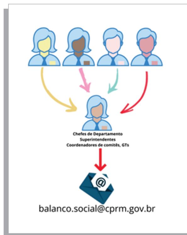
Figura 1 – Fluxo de envio de colaborações ao Grupo de Trabalho do Balanço Social

Após preencher os Anexos 1, 2 e/ou 3, o colaborador deverá enviar o material para seu gestor ou para coordenadores de grupos de trabalho/comitês até o dia 15 de fevereiro de 2023, e estes encaminharão para o e-mail institucional balanco.social@cprm.gov.br até o dia 24 de fevereiro de 2023, conforme cronograma estabelecido (Figura 1).