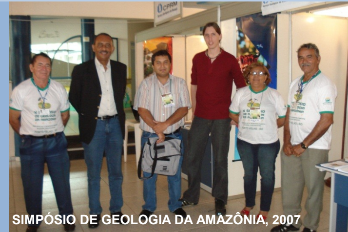
SIMPÓSIO DE GEOLOGIA DA AMAZÔNIA, 2007