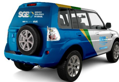
Pajero Tr4 - Traseira