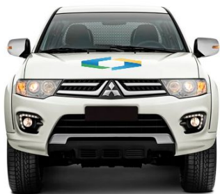
Triton - Frente