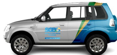
Pajero Tr4 - Perfil