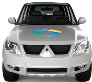
Pajero Tr4 - Frente