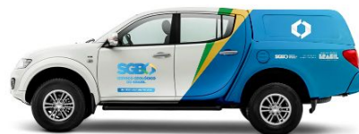
Triton - Perfil