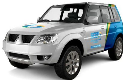
Pajero Tr4 - Semi-perfil