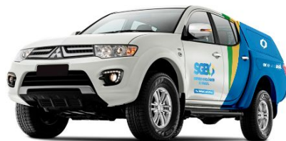
Triton - Semi-perfil